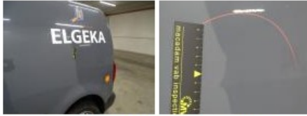
Motorkap, Kras(sen), LI - Herstellen en schilderen (compleet) 217,56