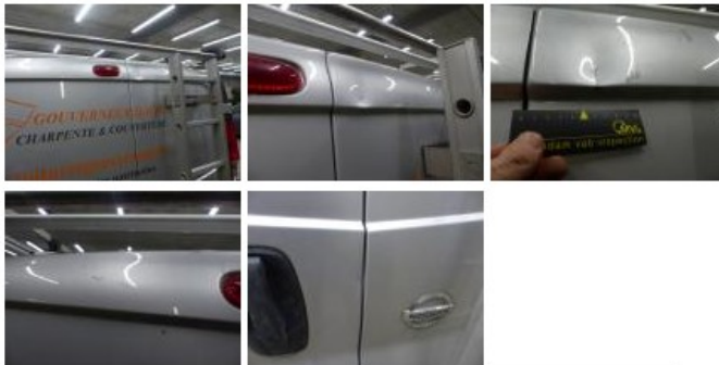
Vleugel A L, Deuk(en) en kras(sen), LI - Herstellen en schilderen (compleet) 279,15