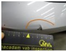
Bumper A, Kras(sen), LI - Herstellen en schilderen (compleet) 211,80