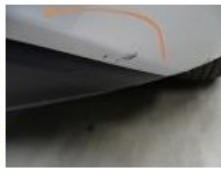
Wieldeksel V R, Kras(sen), E - Vervangen 30,00