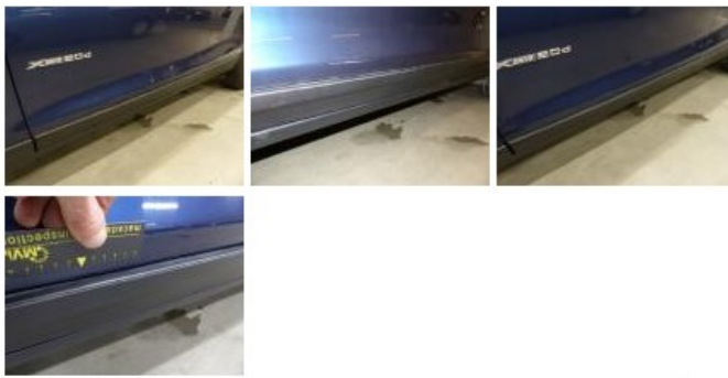
Bumper A, Deuk(en) en kras(sen), LI - Herstellen en schilderen (compleet) 454,16