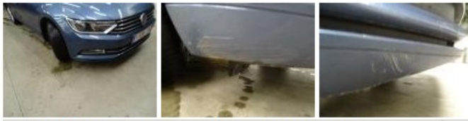
Vleugel V R, Kras(sen), LI - Herstellen en schilderen (compleet) 220,18