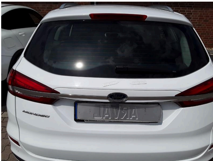
Bild 27 Fahrzeugheck Kofferdeckel / Heckklappe Dellen

Dokument 1174072 Fahrzeug-Kennzeichen DU-SH131 Fahrzeug-Ident.-Nr. WF0FXXWPCFJU56257 Die Lichtbildanlage enthält 30 Fotos