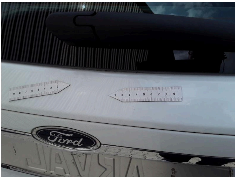
Bild 28 Fahrzeugheck Kofferdeckel / Heckklappe Dellen