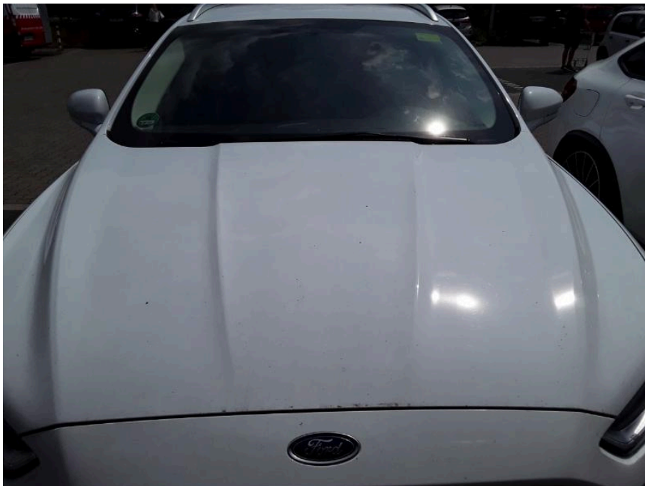
Bild 20 Fahrzeugfront Motorhaube Steinschlag / -schläge