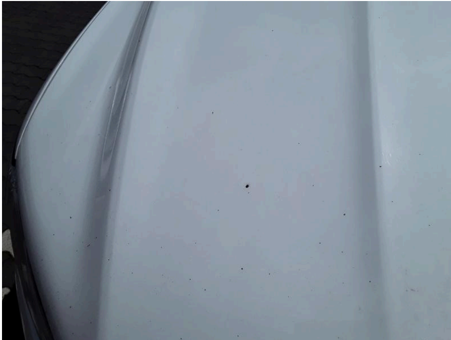
Bild 23 Fahrzeugfront Motorhaube Steinschlag / -schläge

Dokument 1174072 Fahrzeug-Kennzeichen DU-SH131 Fahrzeug-Ident.-Nr. WF0FXXWPCFJU56257 Die Lichtbildanlage enthält 30 Fotos