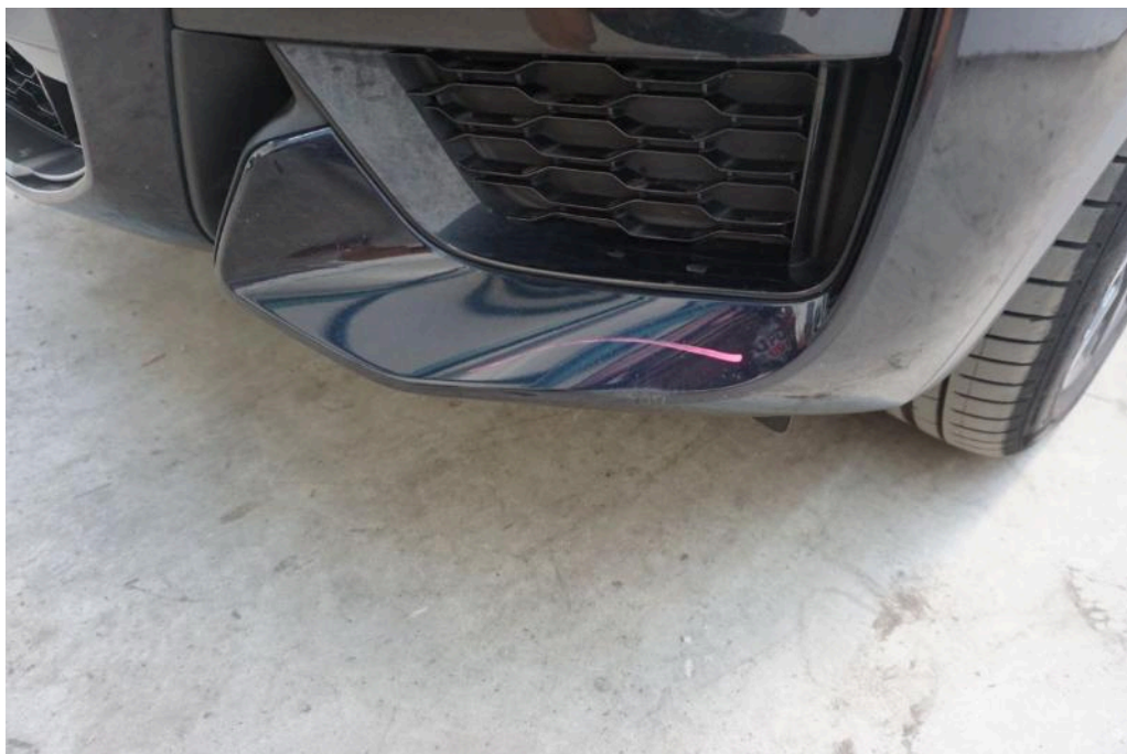
Bild 19 Fahrzeugfront Stoßfänger verschürft Materialabtrag

Dokument 1162661 Fahrzeug-Kennzeichen D-HC2016 Fahrzeug-Ident.-Nr. WBAVJ910809A40540 Die Lichtbildanlage enthält 20 Fotos