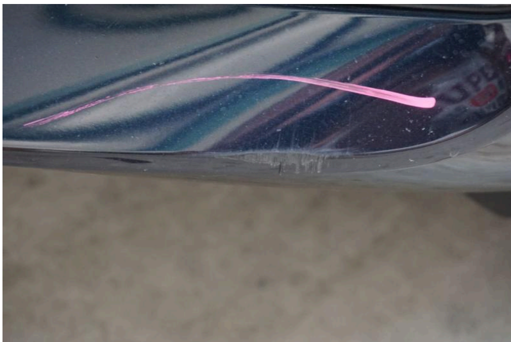
Bild 20 Fahrzeugfront Stoßfänger verschürft Materialabtrag