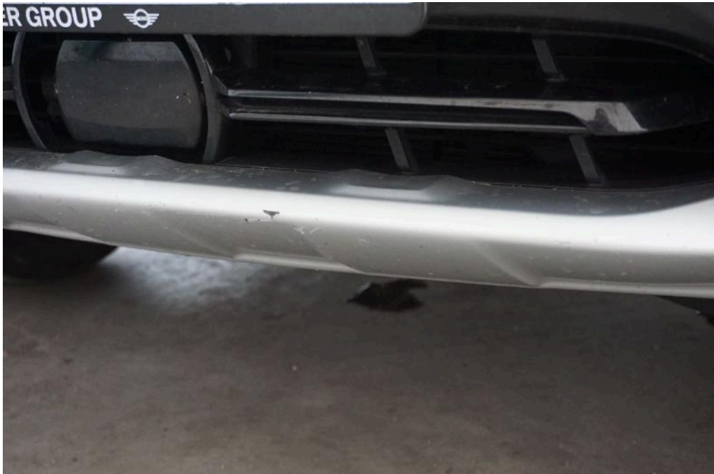
Bild 20 Fahrzeugfront Frontspoiler Kratzer Steinschlag / -schläge