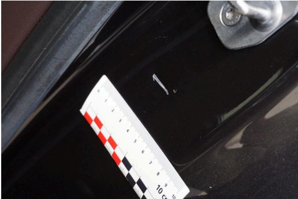
Bild 17 linke Seite C-Säule links Kratzer

Dokument 1313944 Fahrzeug-Kennzeichen F-NQ2018 Fahrzeug-Ident.-Nr. WBATR51040LF97778 Die Lichtbildanlage enthält 20 Fotos