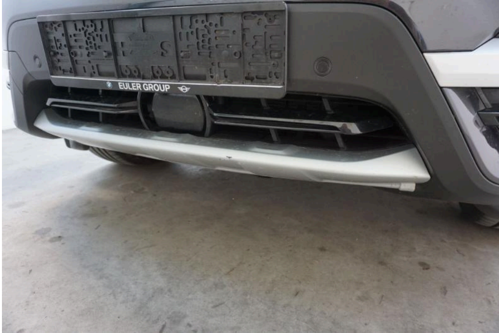
Bild 19 Fahrzeugfront Frontspoiler Kratzer Steinschlag / -schläge

Dokument 1313944 Fahrzeug-Kennzeichen F-NQ2018 Fahrzeug-Ident.-Nr. WBATR51040LF97778 Die Lichtbildanlage enthält 20 Fotos