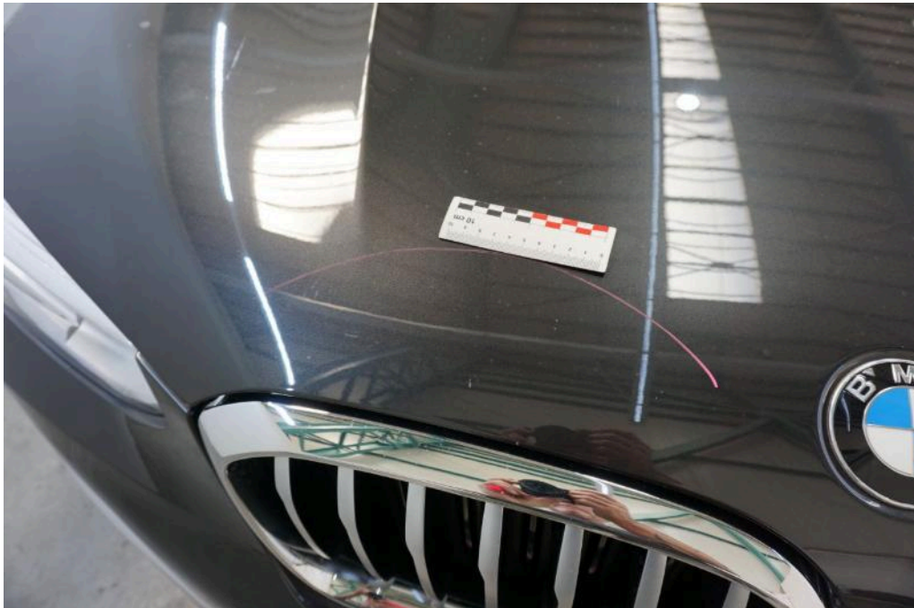
Bild 18 Fahrzeugfront Motorhaube Steinschlag / -schläge