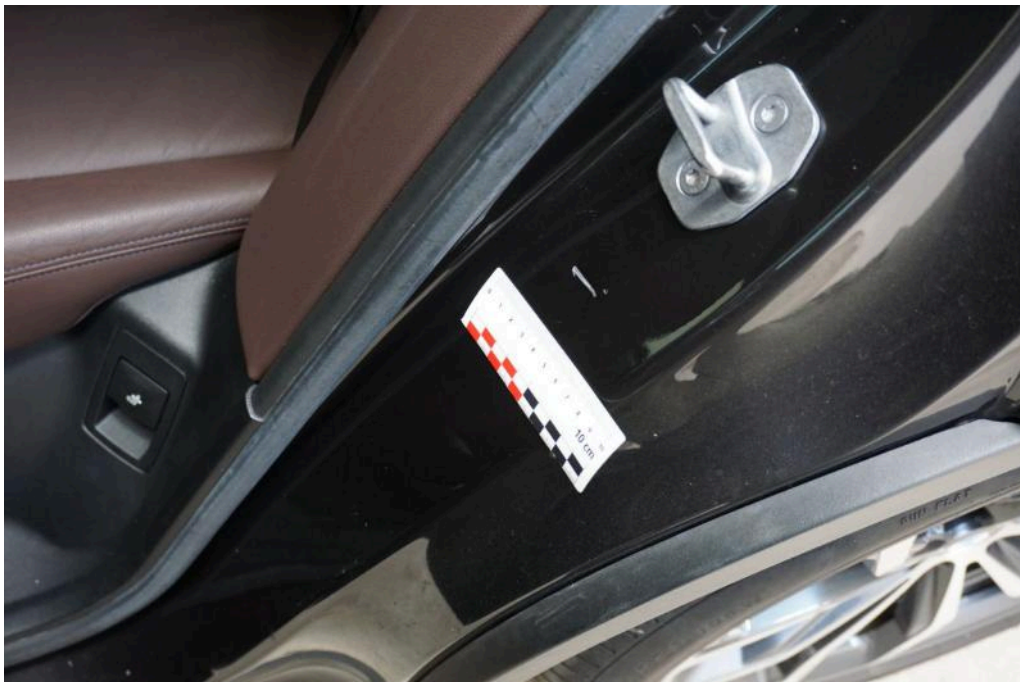
Bild 16 linke Seite C-Säule links Kratzer