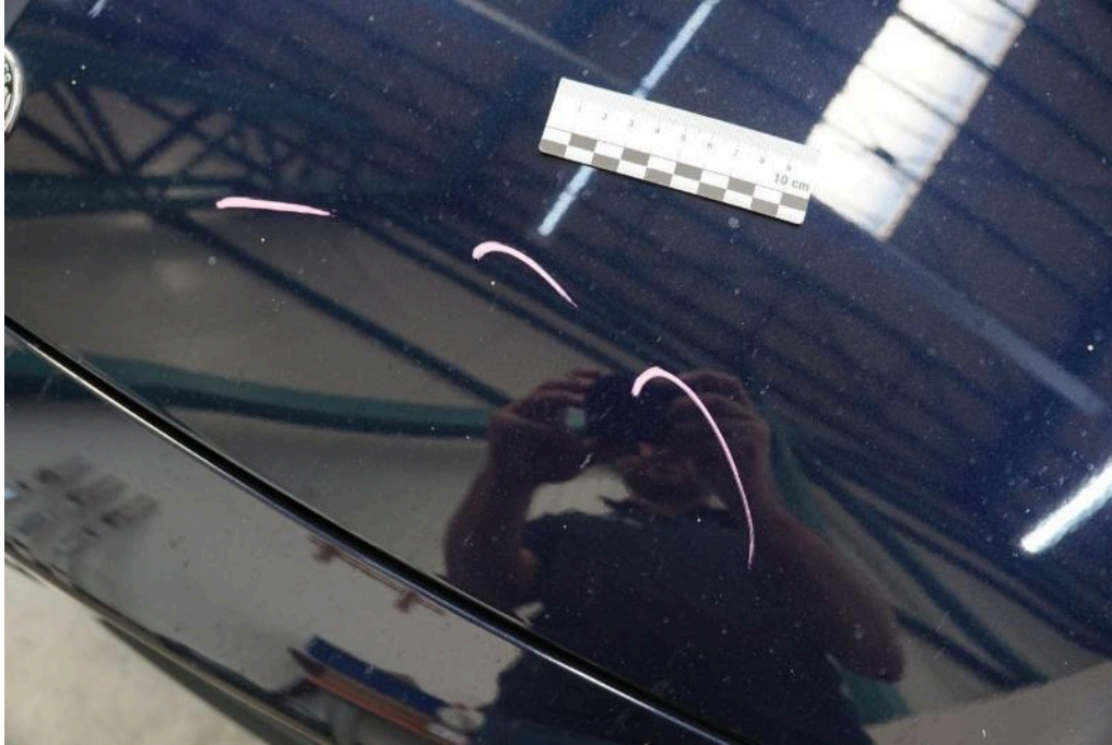
Bild 19 Fahrzeugfront Motorhaube Steinschlag / -schläge

Dokument 1307655 Fahrzeug-Kennzeichen D-SC1332 Fahrzeug-Ident.-Nr. WDD2052141F975956 Die Lichtbildanlage enthält 25 Fotos