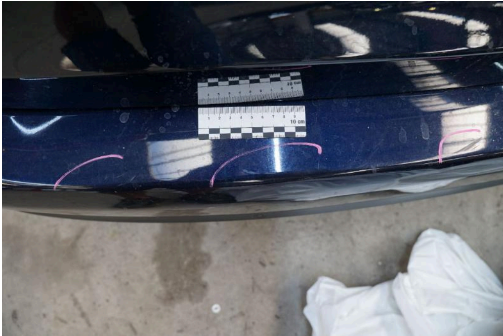
Bild 21 Fahrzeugheck Stoßfänger hinten verkratzt

Dokument 1307655 Fahrzeug-Kennzeichen D-SC1332 Fahrzeug-Ident.-Nr. WDD2052141F975956 Die Lichtbildanlage enthält 25 Fotos