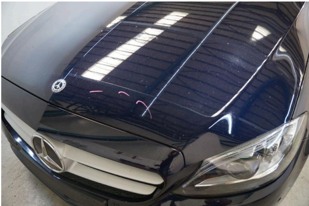
Bild 18 Fahrzeugfront Motorhaube Steinschlag / -schläge