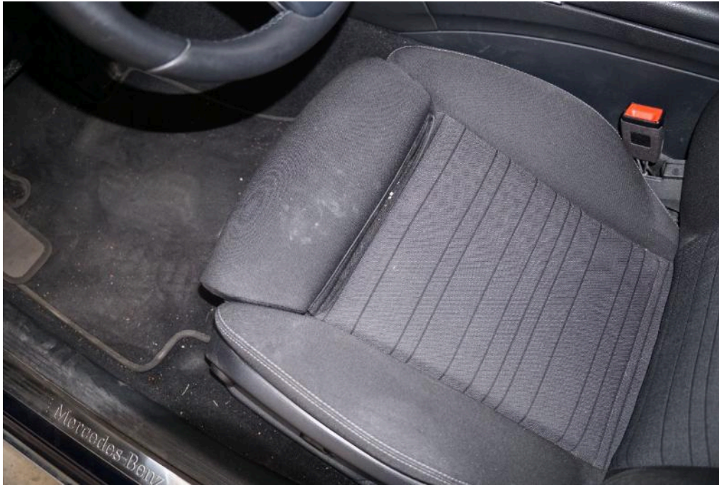
Bild 25 Innenraum Sitz vorn links verschmutzt

Dokument 1307655 Fahrzeug-Kennzeichen D-SC1332 Fahrzeug-Ident.-Nr. WDD2052141F975956 Die Lichtbildanlage enthält 25 Fotos