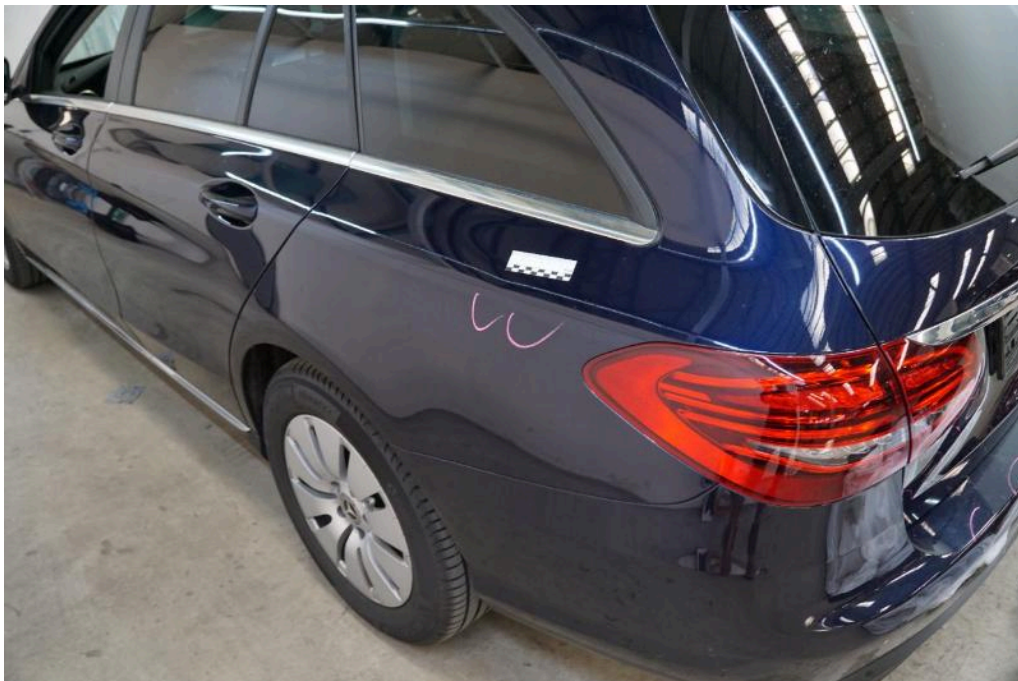
Bild 22 linke Seite Seitenwand hinten links Dellen