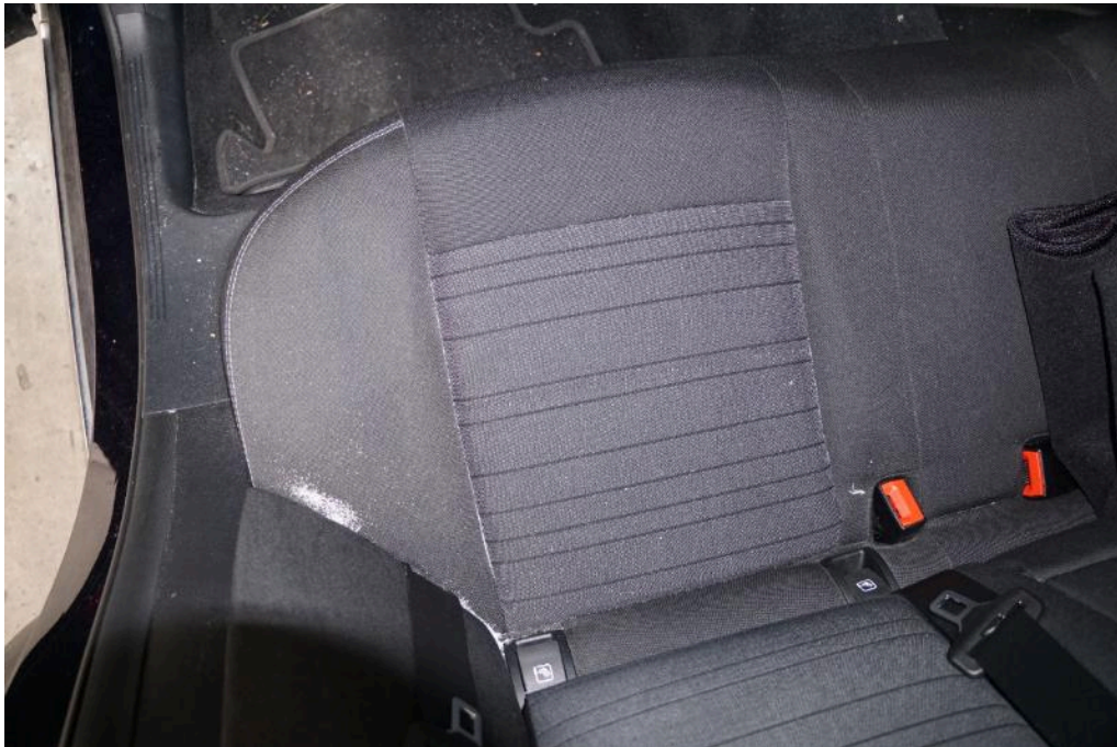
Bild 24 Innenraum Rücksitzbank verschmutzt