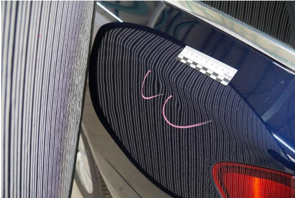
Bild 23 linke Seite Seitenwand hinten links Dellen

Dokument 1307655 Fahrzeug-Kennzeichen D-SC1332 Fahrzeug-Ident.-Nr. WDD2052141F975956 Die Lichtbildanlage enthält 25 Fotos