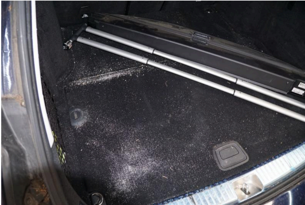
Bild 17 Innenraum Kofferraum verschmutzt

Dokument 1307655 Fahrzeug-Kennzeichen D-SC1332 Fahrzeug-Ident.-Nr. WDD2052141F975956 Die Lichtbildanlage enthält 25 Fotos