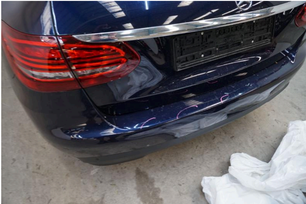
Bild 20 Fahrzeugheck Stoßfänger hinten verkratzt